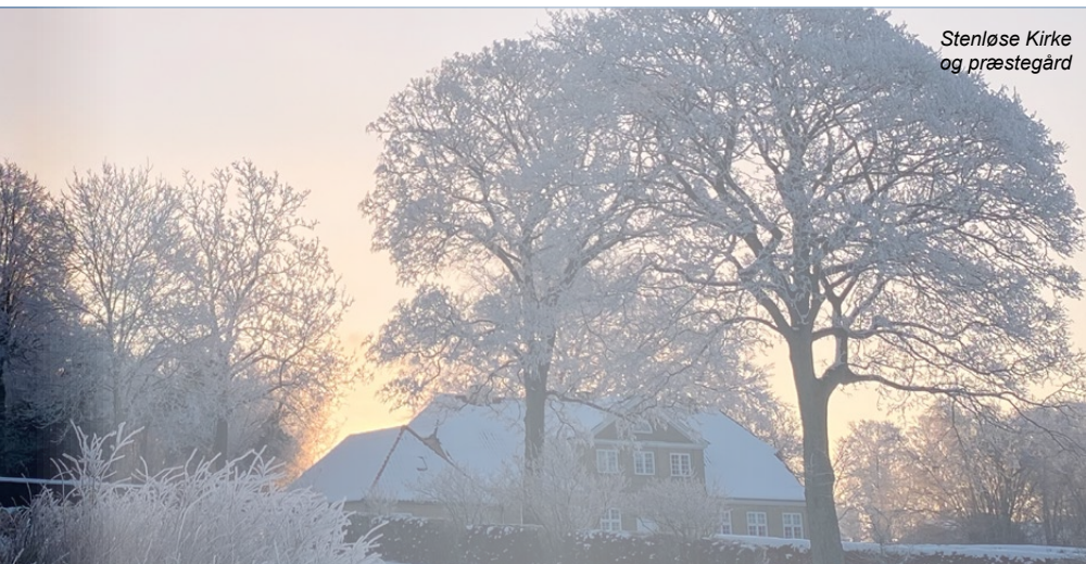
Stenløse Kirke og præstegård